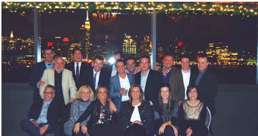
Asistentes al Dental Meeting 2014

El congreso está dirigido a odontólogos de todas las especialidades, estudiantes de odontología, auxiliares, asistentes de dentistas, higienistas y técnicos de laboratorio.