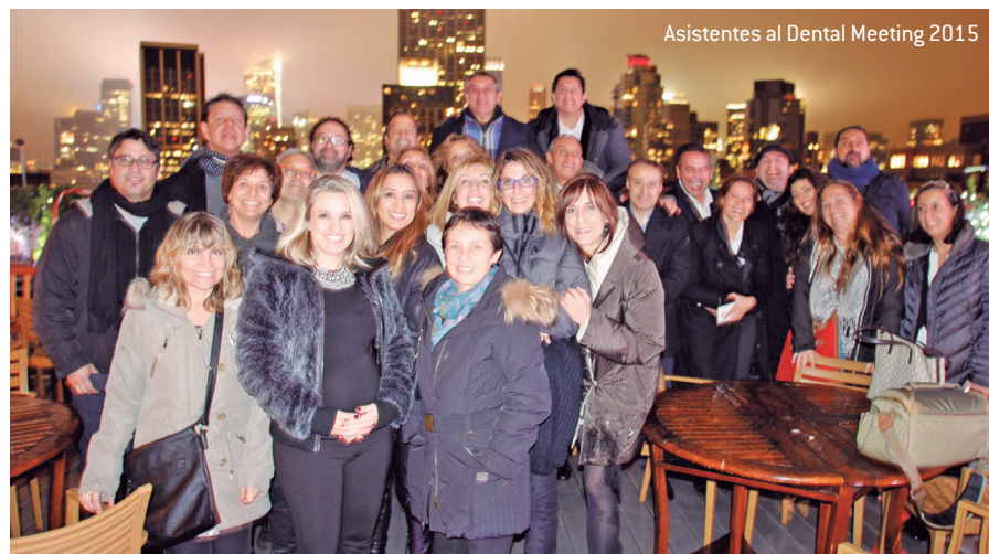
Asistentes al Dental Meeting 2015

La edición 2016 presenta, una vez más, un itinerario educativo sin precedentes que además de un extenso programa en español, ofrece una gran variedad de seminarios, ensayos, foros didácticos, talleres prácticos y demostraciones en vivo que seguro fascinarán incluso al dentista más exigente.