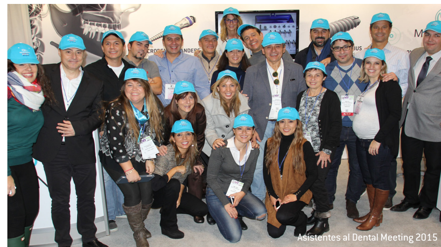
Asistentes al Dental Meeting 2015