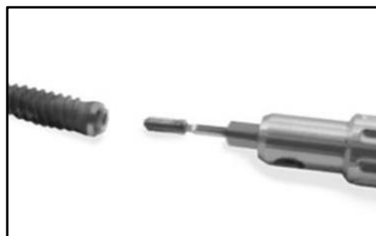
11. Extraer la espiga.