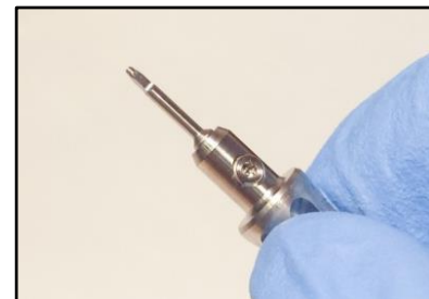
8- Seleccionar el punzón de extracción.