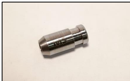
2- Seleccionar la guía de centrado según conexión y plataforma.