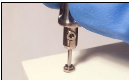
9- Insertar el punzón en la espiga.