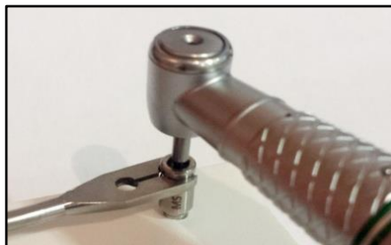
6. Perforar directamente en la guía de centrado con el contraángulo.