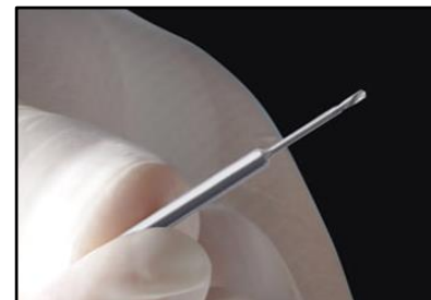
4- Seleccionar la fresa FEX100.