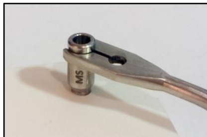
3- Colocar la guía de centrado sobre el implante mediante la llave.