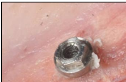
1- Visualizar la espiga incrustada.